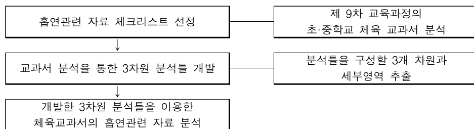
[그림 III-1] 연구절차

본 연구에서는 체육 교과서에 사용된 흡연예방 자료를 체계적이고 효과적으로 분석할 수 있고, 흡연예방 자료를 체육 수업에 도입할 때에도 활용할 수 있는 3차원 틀을 개발하였다. 3차원 틀 개발을 위해, <표 III-3>과 같이 현재 학교에서 사용하고 있는 13종(초등학교 3종, 중학교 10종)의 체육 교과서(2009 개정)에 수록된 흡연과 관련한 자료를 먼저 분석하여 체크리스트를 구성하여 각 요인이 교과서에 수록되어 있는지의 유무를 양적으로 분석 하였고, 이 분석 결과를 바탕으로 세 개의 차원과 각 차원에 따르는 9개의 세부영역을 포함한 3차원 분석틀을 개발하였다. 또한 개발한 분석틀을 이용하여 체육 교과서의 흡연관련 자료를 질적으로 분석하였다. 연구절차는 [그림 III-1]과 같다.