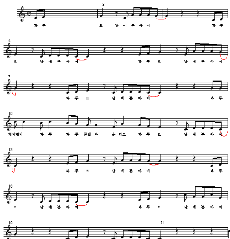
[그림 2] ‘파투요’ 악보